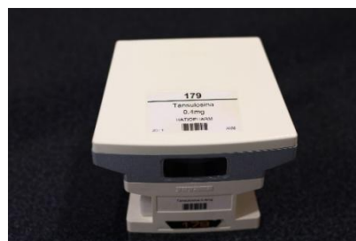
Fig. 3 – Cassete individual identificada com o medicamento e marca calibrados 8