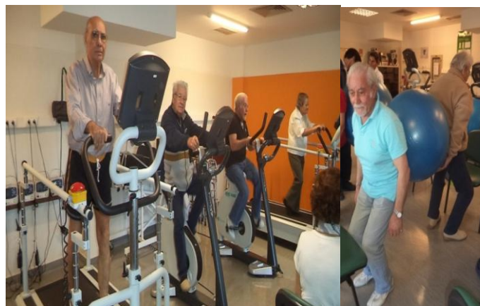
Fig .2– Exercícios realizados no Programa de Reabilitação Geriátrica 12