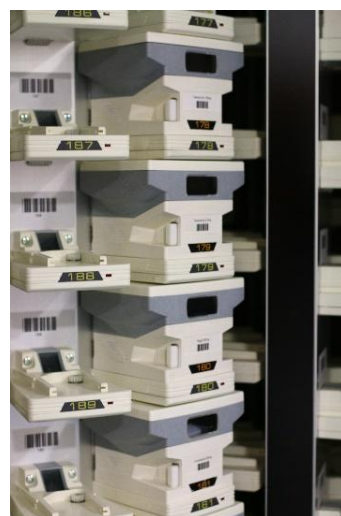
Fig. 2 – Cassetes Individuais onde são armazenados os medicamentos no FDS 8

Estas características facilitam o processo de validação da reposição de stocks das cassetes por parte do Técnico de Farmácia.