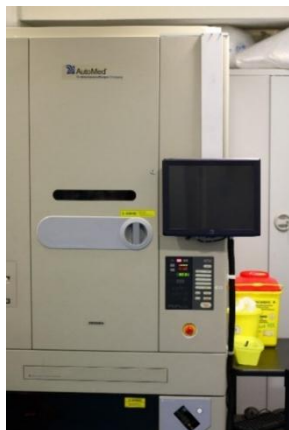
Fig. 1 – FDS 8

O FDS (fig. 1) é um equipamento de distribuição automatizada de medicamentos, que permite reembalar e identificar formas sólidas orais (comprimidos e cápsulas) de forma individualizada, ou de acordo com a dose unitária prescrita para cada doente, para um período de 24 horas, o que representa a sua maior vantagem.