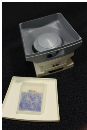
Fig. 4 – Cassete individual identificada com a amostra do medicamento calibrado 8